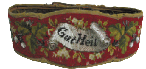
Gestickter Turner-Prunkgürtel, 2. Hälfte des 19. Jh.

E-mail: ifs@maulbronn.de / www.ifs-gbw.de